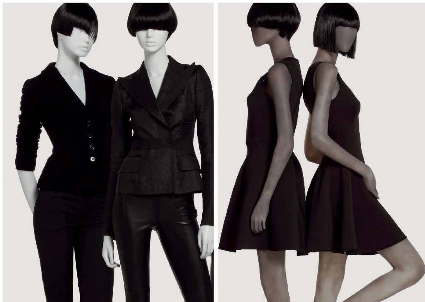
ASTRATTO TESTA FISSA

Sono disponibili varie finiture partendo dalla supercie verniciata alla resina trasparente.