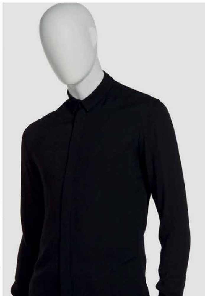
TESTA A UOVO TESTA FISSA