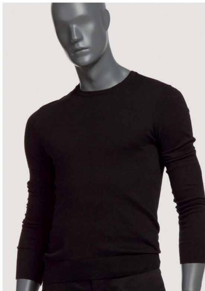
ASTRATTO TESTA FISSA

Sono disponibili varie finiture partendo dalla superficie verniciata alla resina trasparente.